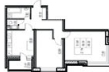
2-комн. 58,2 м 2 - 4 590 000