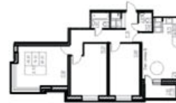
3-комн. 81 м 2 - 6 309 000

Мы поможем вам сделать правильный выбор и приобрести квартиру, которая станет предметом вашей гордости!