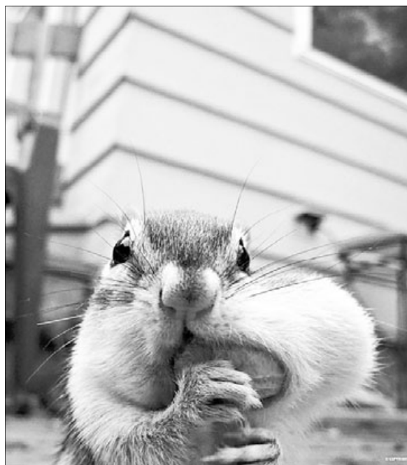
Добыто на просторах сети интернет

Зашёл в одну контору, которую охраняют коротко стриженные молодые люди под два метра ростом, в камуфляжах, с рациями, газовыми баллончиками и так далее. Своим грозным видом они пугают посетителей, следят за тем, чтобы никто ничего из конторы не утанул. Последнее им удаётся, очевидно, не всегда. Подтверждением тому следующее объявление при входе: «Уважаемые посетители! Кто из вас вынес стол из поста охраны. Просим вернуть или указать, где он».