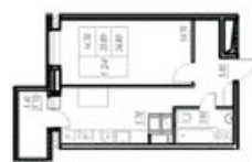
1-комн. 34,9 м 2 - 2 853 000