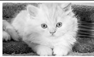
Ухтинский питомник шотландских кошек KetMari продаёт котят с полным пакетом документов. Т. 8-950-569-45-42, vk.com/ketmari

• Продам белого декоративного крольчонка породы бабочка, ручной. Т. 8-904-274-80-86.